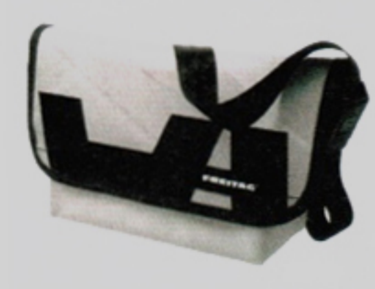
Freitags immer! Der klassische Messenger Bag von Freitag