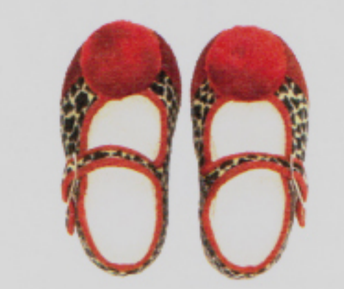
Jöh-Design seit 1938: Tigerfinkli, hier von Tiger-Fink