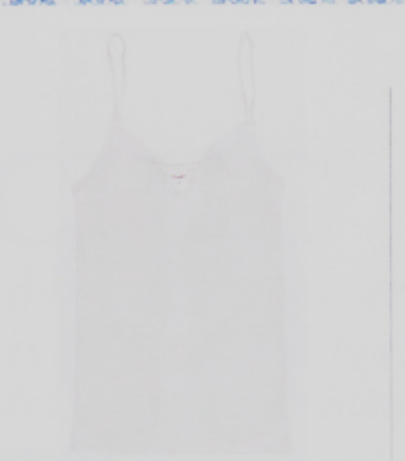
Nicole Kidman trugs in «Eyes Wide Shut»: Camisole 1501 von Hanro