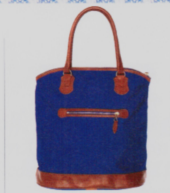
Canvastasche von Mode-Doyenne Sissi Zöbeli bei Thema Selection