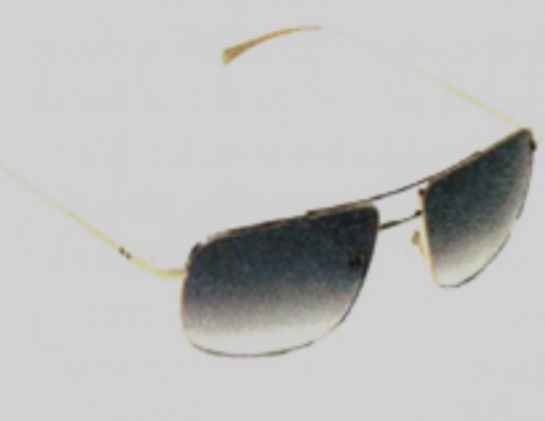
Aviatorbrille Percy von Swiss-Economic-Award-Preisträger Götti