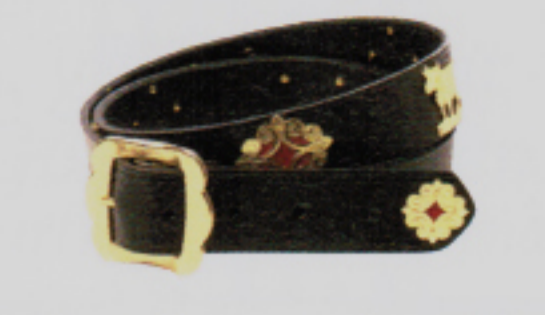
Was an Bäri gut aussieht, gefällt auch uns: Appenzeller Gürtel