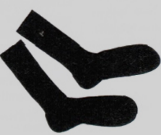
Kein Rutschen, kein Einschneiden: Herrensocken von Rohner