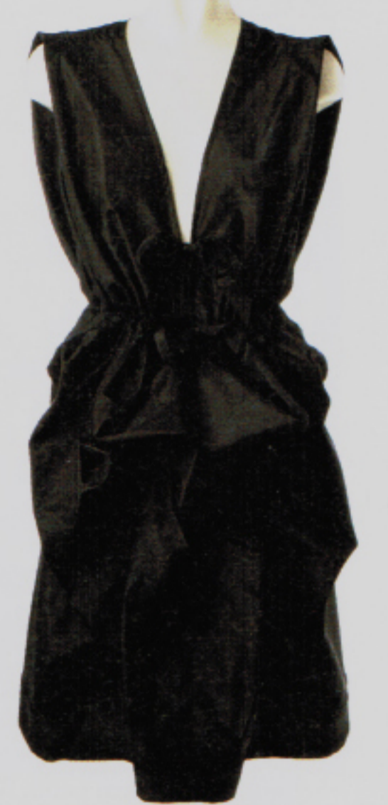
Cocktailkleid vom Meister der Demi-Couture Heinrich Brambilla