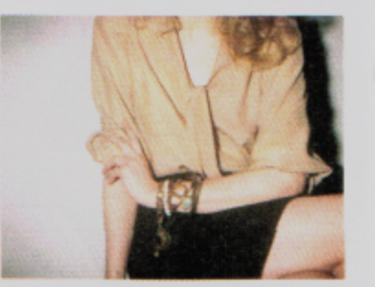
Urban, sec, chic: Seidenbluse und Lederjupe von Dorothee Vogel