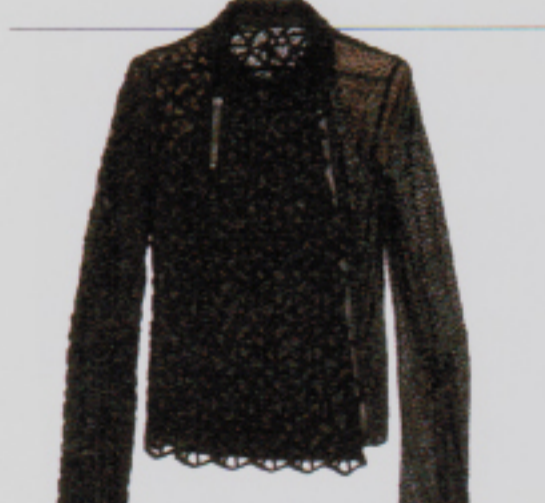
St. Galler Strickerei vom Feinsten: Jacke von Akris