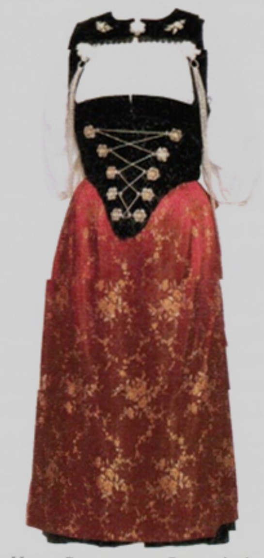
Haute Couture vom Bauernhof: Berner Sonntagstracht