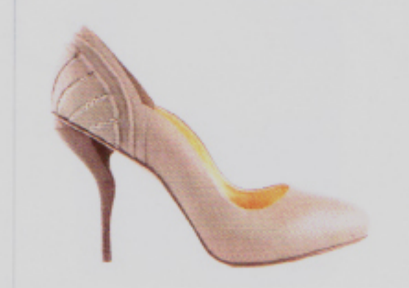
Schweizerisch-brasilianisch hoch hinaus: Pumps von Lele Pyp