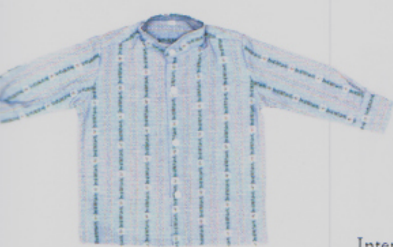
Im Stall? In der City? Immer cool! Bauernhemd mit Edelweissmotiv