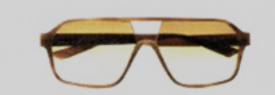
Am Anfang stand Industriedesign: Sonnenbrille aus Horn von Sire