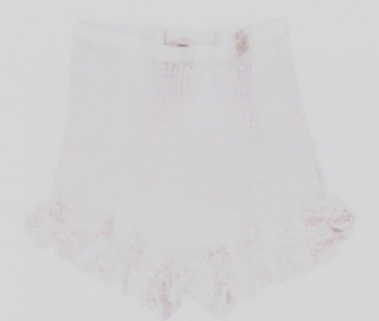
Jersey, auf den Hollywoodstars und Könige schwören: Zimmerli