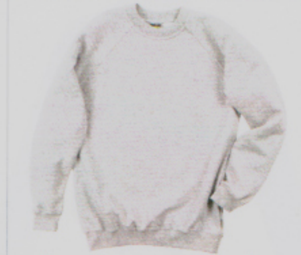
Sweatshirt von Switcher, dem Schweizer Fairtrade-Pionierlabel