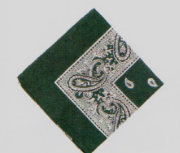
Vom Nastuch zum Kultobjekt: Glarner Tüechli von Heimarwerk