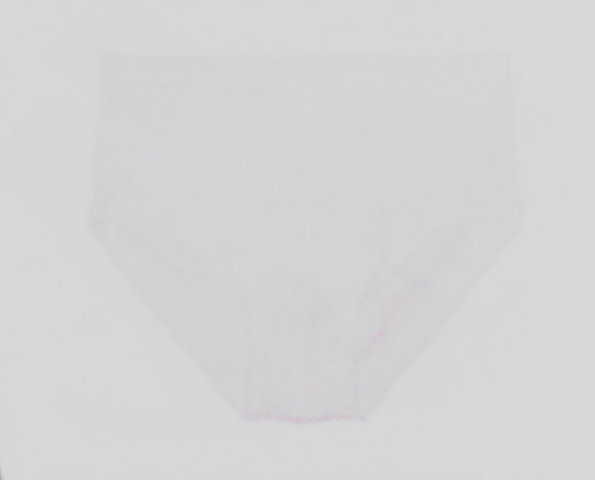
Luzerner Qualitätswäsche seit 1941: Männer-Midislip von Calida