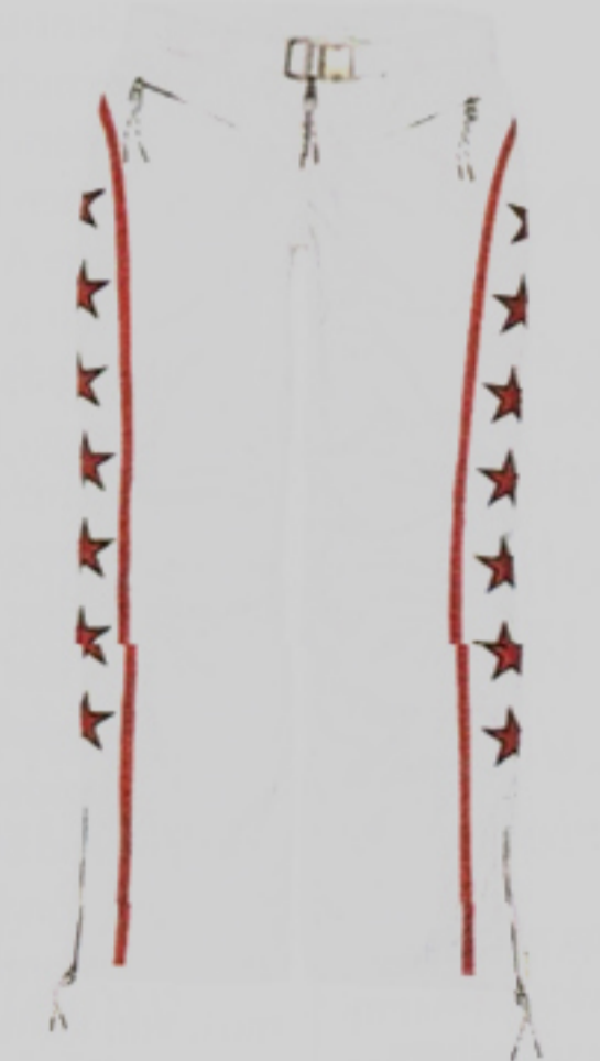
Skihose und Weste von Jet Set, dem angesagten Label der Eighnies