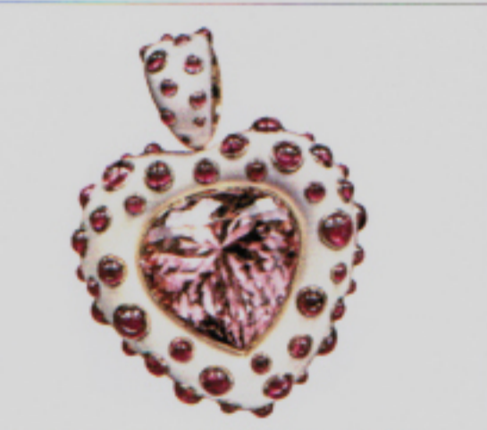
Barocke Note: Herzanhänger aus Roségold mit Morganit und Rubelliten von Majo Fruithof