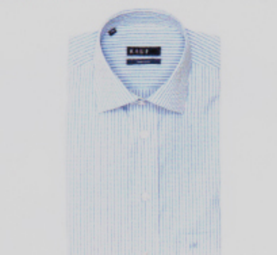
Familiensache seit 1904: Herrenhemden von Kauf