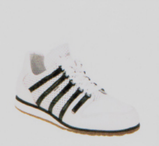
Die mit den fünf Streifen: Sneakers Spectron von Künzli