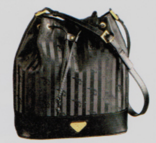
Der Name sagt's: Beuteltasche Niesen von Maison Mollerus