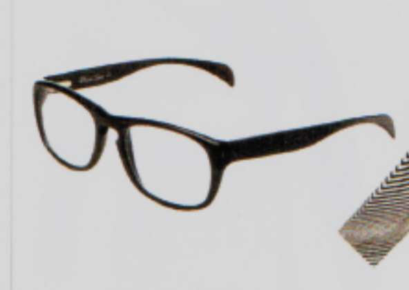
Jede ein Unikat: Hornbrille Chaud Lapin von Alain Benoit