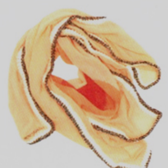
Hundert Prozent Handarbeit: Seidentuch von Ikou Tschüss