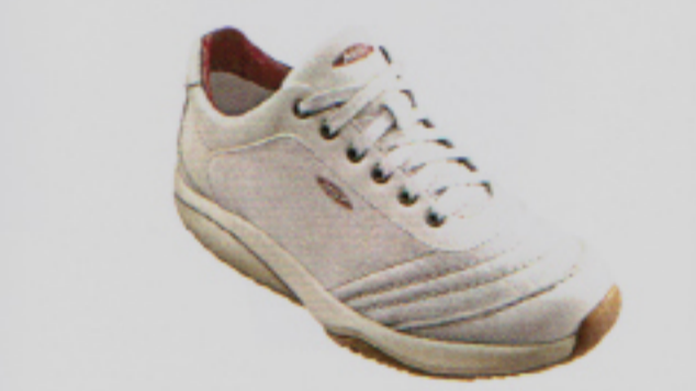
Als die Schuhe laufen lernten: Sneakers Tataga C Birch von MBT