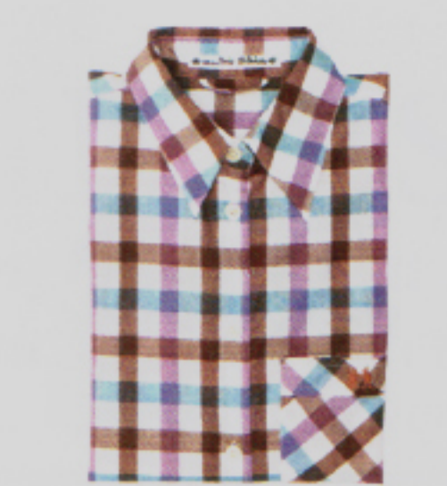
Kleinkariert? Von wegen! Karobluse von En Soie