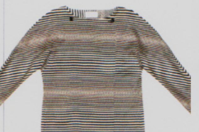
Japan meets Zurich: Couture-Jacke von Kazu