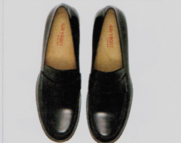
Seit 1991 im Premium-Segment: Pennyloafers von Navyboot