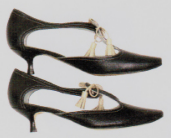
Unverkennbarer Stil: Pumps mit Kittenheel von Stefi Talman