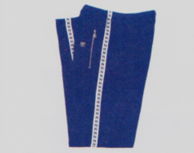
Nostalgie pur – nun mit Hoody: Jogginganzug von Nabholz