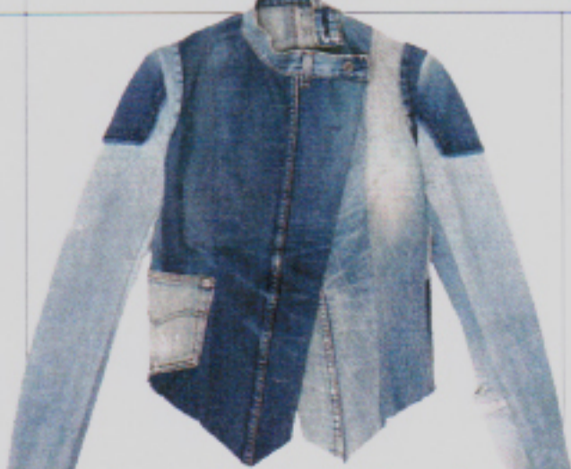
Aparte Details: Patchwork-Jeansjacke von Nina van Rooijen