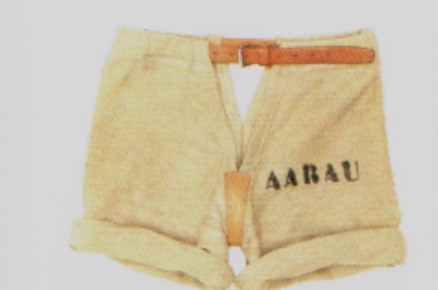
Stylingtripp: Schwingerhose über Röhrhose – sieht Hammer aus!