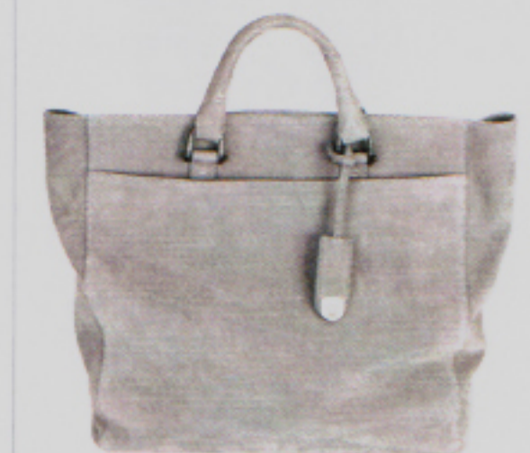
Neuer Schweizer Tragkomfort: Tasche Aura Large von Van Astyn