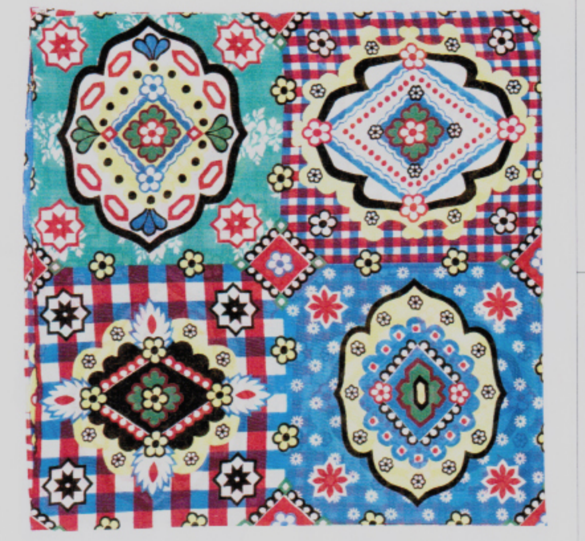
Schnsucht nach dem Land: Baumwolltuch von Sonnhild Kettler