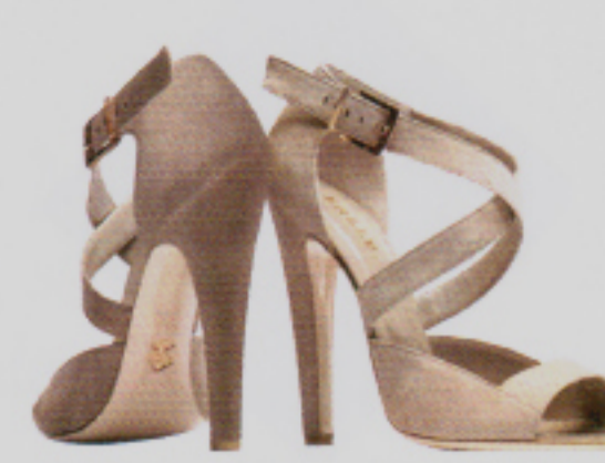
In Sachen Schuh der Inbegriff von Swiss Heritage: Bally