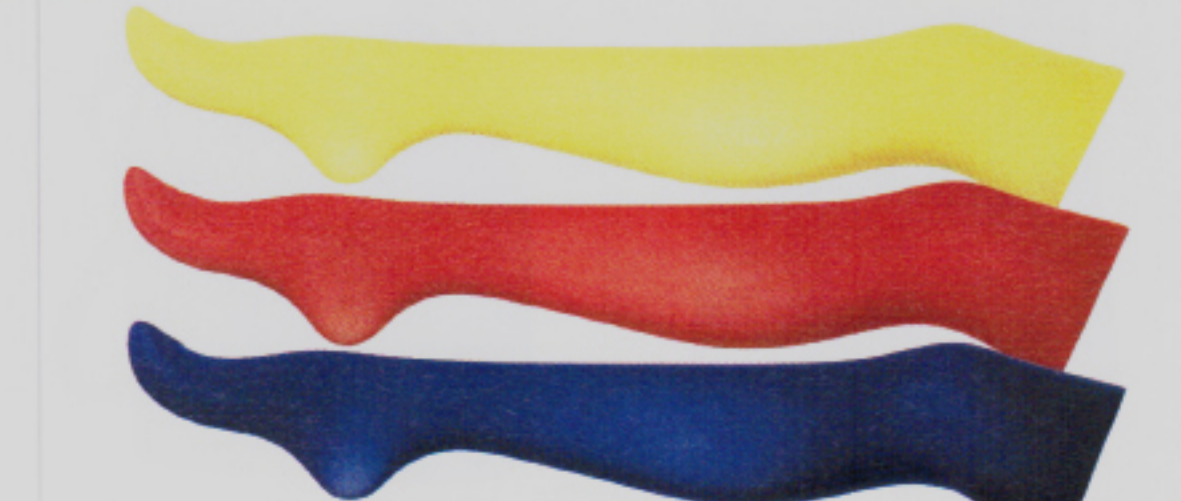
So mögen wir Farbe am Bein: Strumpfhose Opaque 138 von Fogal