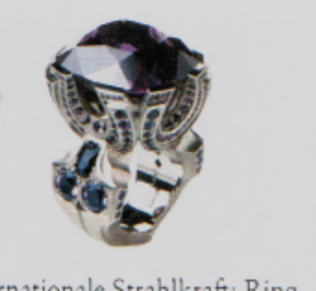
Internationale Strahlkraft: Ring aus Weissgold mit Amethyst und Spinell von Christophe Graber