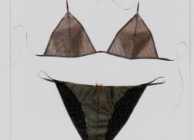
Swiss Sexiness: Latexdessous von Daniel Herman