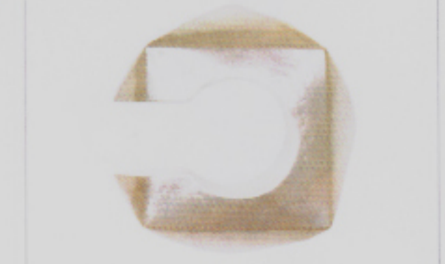
Prezios: Silberarmreif von E-Kollektion by Ernesto Sturzenegger