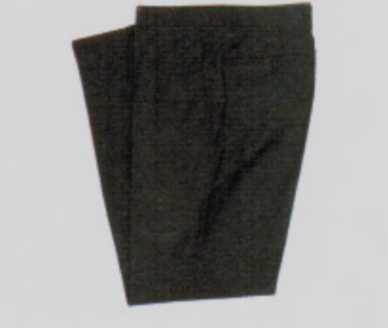
1984 wird die Schale neu erfunden: Herrenanzug von Strellson